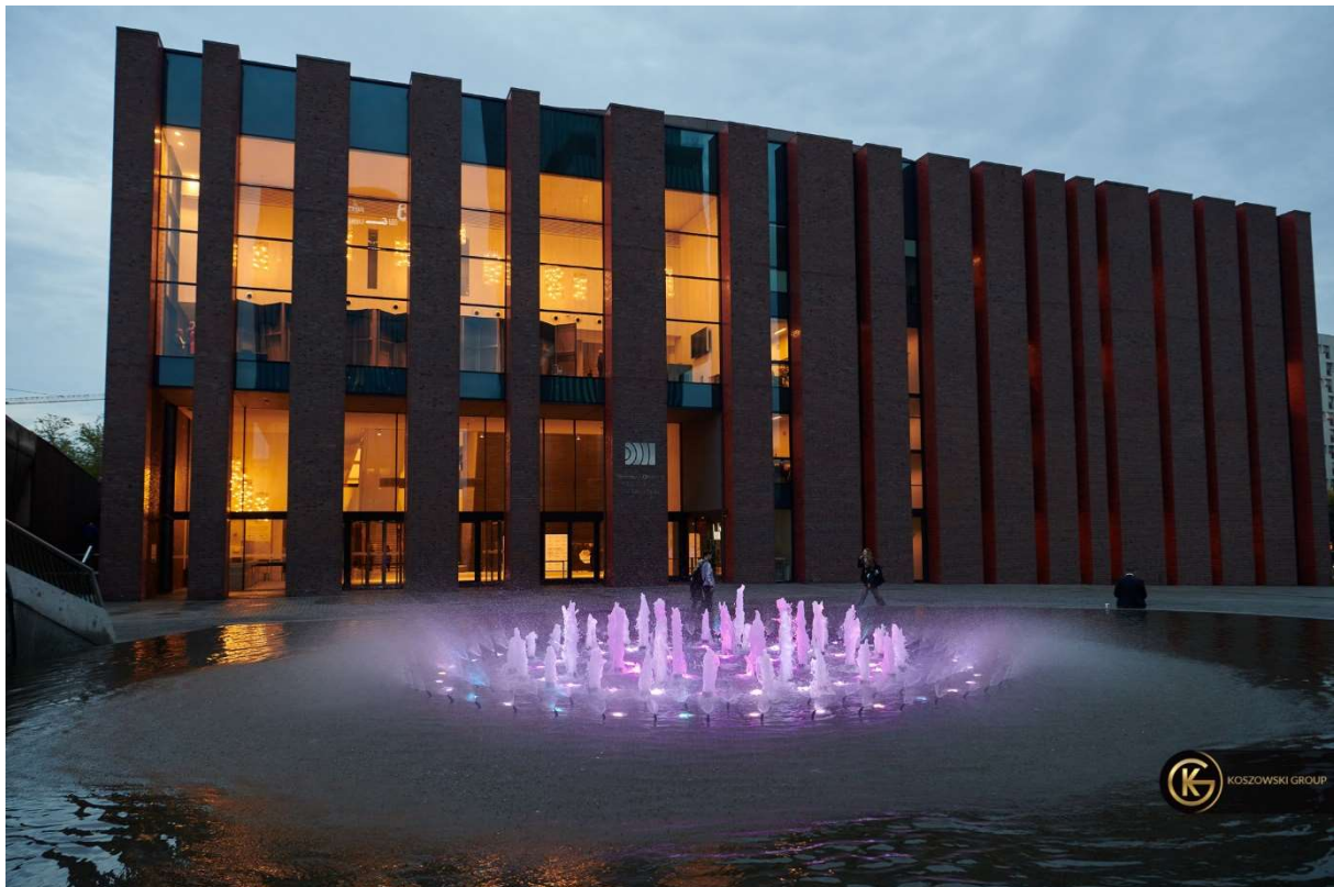
Gala 100-lecia Izby Adwokackiej w Katowicach