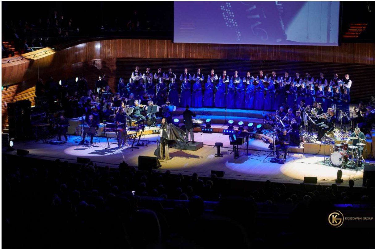
Gala 100-lecia Izby Adwokackiej w Katowicach