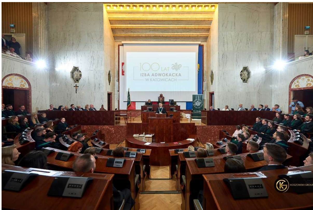
Ślubowanie Adwokackie w Sali Sejmu Śląskiego

Dziekan mówił o niezwykłości zawodu adwokata i stojącymi przed nim wyzwaniami.